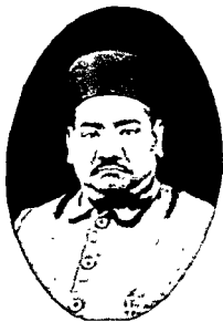
भी शिवनारायण, आगरा